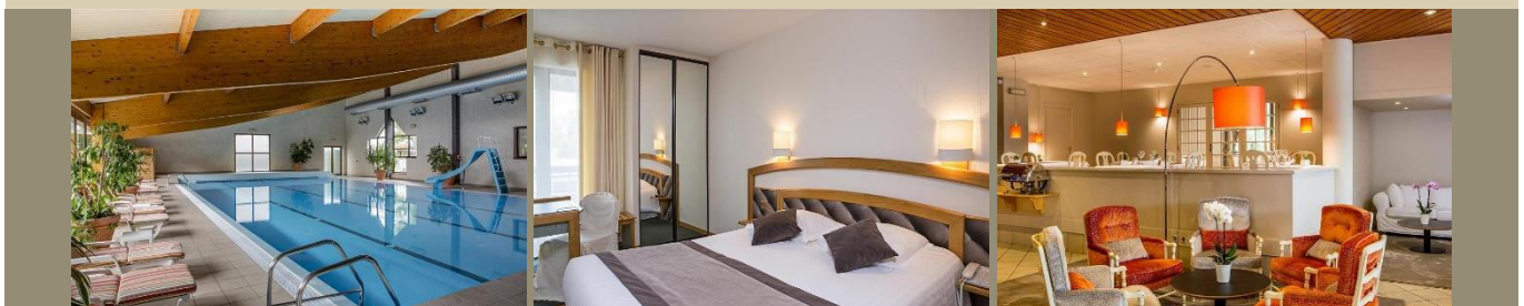
Photos de chambres non contractuelles